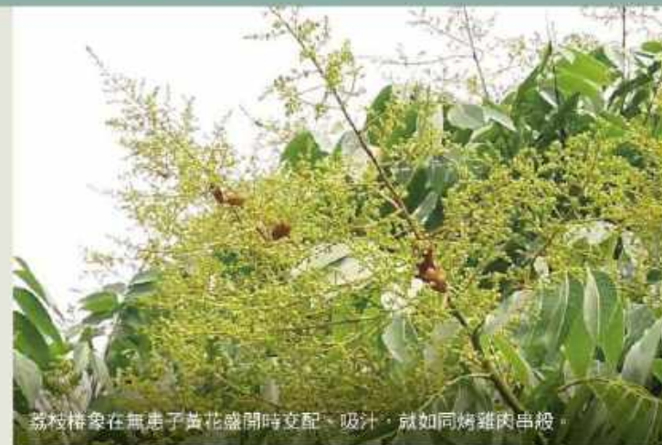
荔枝椿象在無患子黃花盛開時交配、吸汁，就如同烤雞肉串般。