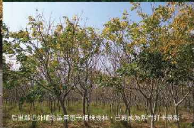
后里鄰近外埔地區無患子植株成林，已經成為熱門打卡景點。