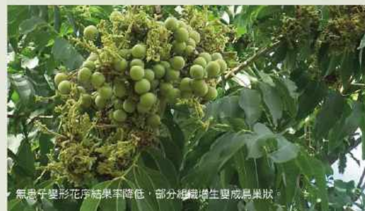
無患子變形花序結果率降低，部分組織增生變成鳥巢狀。