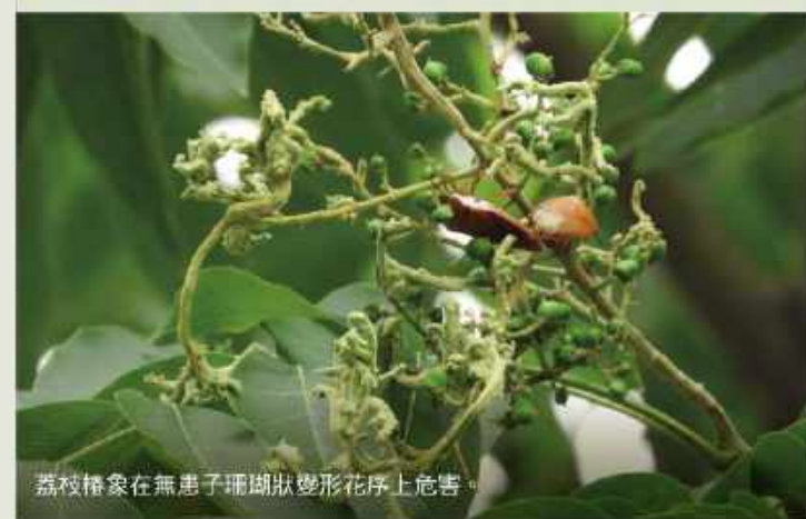
荔枝椿象在無患子珊瑚狀變形花序上危害。