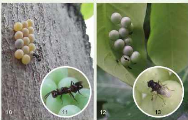
8：簷下姬鬼蛛捕食荔枝椿象。